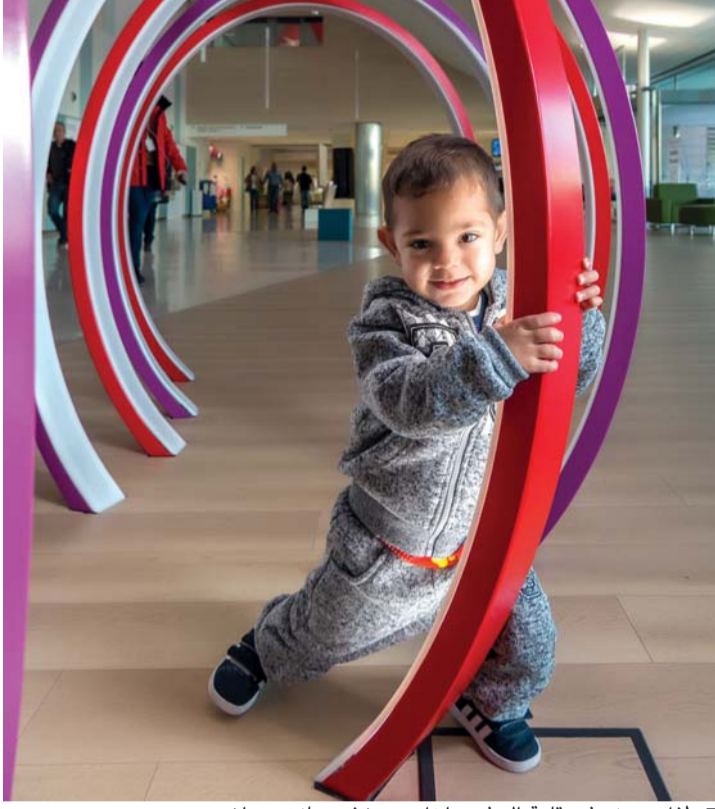
■ طفل مريض في قاعة الترفيه داخل مستشفى سانت جوان دي ديو

أنتم متخصصون في حالات الطب بالغة التعقيد. هل من الممكن أن تعطينا مثلاً على ذلك؟ حالات الحمل والولادة شديدة الخطورة، بما في ذلك جراحة الأجنة؛ عمليات جراحية للجنين وهو لا يزال داخل رحم الأم، إما عن طريق المنظار، أو عن طريق استخراجها، وإجراء الجراحة له وإعادة إدخاله مرة أخرى في الرحم. ولدنيا واحد من أكثر الفرق الطبية الرائدة والمتطورة على مستوى العالم، وعلى رأسهم الدكتور إدوارد غراتاكوس، جنباً إلى جنب مع مستشفى برشلونة الطبي. ومثال آخر هو عمليات جراحة القلب للأطفال حديثي الولادة عن طريق القسطرة، أو حالات عدم انتظام ضربات القلب، التي يعالجها الدكتور