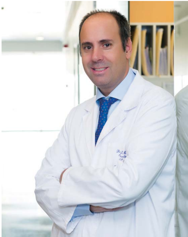
د. خافيير كورتيس رئيس وحدة سرطان الثدي في معهد «باسيلغا» للأورام (IOB)

ملاحظة أن بعض الأدوية المستخدمة في إسبانيا تستخدم بصعوبة في المملكة المتحدة بسبب السعر. في ألمانيا، على سبيل المثال، بعض المراكز رائعة، ولكن هناك مراكز أخرى الجودة فيها لا تقارن بجودتنا. ونفس الشيء يحدث في فرنسا، حيث لا يتم عادة فحص المريض، في كثير من الأحيان، من قبل رئيس البرنامج. علاج سرطان الثدي بنسبة 100٪؟ في إسبانيا يعد سرطان الثدي أكثر الأمراض شيوعاً بين النساء، والثاني من حيث عدد الوفيات، بعد سرطان الرئة، إلا في الأعمار التي تتراوح ما بين 25 و45 عاماً، حيث يكون الأكثر في معدل الوفيات، في الطب ما من مرض يتم علاجه بنسبة 100٪، حتى التهاب الزائدة الدودية يمكن أن يكون معقداً، ولكن كل يوم يتم علاج المزيد من المرضى. قبل 30 عاماً كانت نسبة العلاج هدفنا إلا يكون هذا المرض فتاكاً للغالبية العظمى. ما الذي يميز مدريد وبرشلونة عن هيوستن في مجال علاج سرطان الثدي؟ تشخيص مرض السرطان في إسبانيا هو من بين الأفضل في العالم. وفي معهد باسيلغا (IOB) يقوم رؤساء البرامج بأنفسهم بفحص المرضى الوافدين من الخارج. الأمر ليس كذلك في كثير من المراكز الدولية الأخرى خارج إسبانيا وهذا ما يجذب إلينا المرضى من دولة الإمارات العربية المتحدة بشكل خاص. وبالإضافة إلى ذلك، فإن تكلفة الدواء في إسبانيا أقل منها في دول أخرى في العالم. هناك أدوية يصل سعرها إلى 2000 يورو أما في إسبانيا فسعرها 20 يورو فقط.