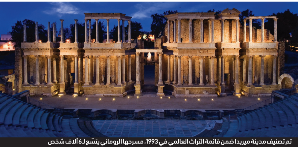
تم تصنيف مدينة ميريدا ضمن قائمة التراث العالمي في 1993. مسرحها الروماني يتسع لـ6 آلاف شخص

ترتبط إكستريمادورا بعلاقات وثيقة مع المستثمرين الإماراتيين، فهي لا تملك النفط بل الماء، وتنتج الطاقة الكهروضوئية، وتتمتع بسياحة نشطة وبكل الموارد الطبيعية المطلوبة للاستثمار في تكنولوجيا الطاقة والنقل بواسطة المركبات الكهربائية. وتضم إكستريمادورا أكبر مقاطعتين في إسبانيا هما: كاسيريس وباداخور، حيث يعيش أكثر من مليون شخص.