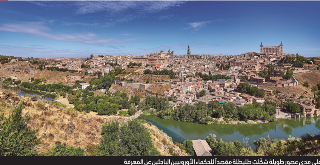
على مدى عقود طويلة شكّلت طليطلة مقصداً للحكماء الأوروبيين الباحثين عن المعرفة

يزور رئيس قشتالة-لامنتشا الإمارات نوفمبر الجاري، لاستكشاف الفرص الاستثمارية مع ممثلي القطاع العام الإماراتي في لامنتشا، أول منطقة حكم ذاتي تشارك بشكل مؤسسي بجناب إسبانيا بـ«إكسبو 2020 دبي».